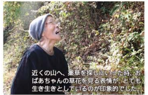
近くの山へ、薬草を探しにいった時、おばあちゃんの草花を見る表情が、とても生き生きとしているのが印象的でした。

す。おばあちゃんは、早川町には山に行けばたくさんさんの薬草が手に入る良い環境が残っているからこそ、この知恵を後世に伝えていきたいと強く思うそうです。 また、最近では、便利になった反面、人任せの部分が多くなって、人の道徳心が低くなっていると感じるそうです。自分の手をかけて生活すれば、自分でできないことや、人にかけてもらうことのありがたさ、そして人と支え合う大切さに気づき、正しく生きようとする。これは、おばあちゃんにとって、親の背中を見て育つ中で自然に身についたものでした。 民間療法も、自分の手をかけてつくり上げる暮らし方の一面です。民間療法の知恵と一緒に、人としての心のあり方も受け継いでいきたいと感じました。