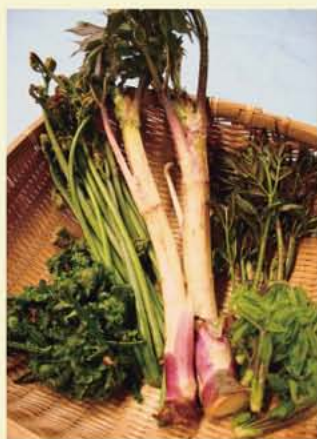
右から、コシアブラ、タラの芽、ウド、ワラビ、コゴミ

春を告げる食べ物と言えば、そう、おいしい山菜ですよ！年に一度の山からの恵みです。早川の大自然が育んだ山菜の、香り高い風味を楽しむことができます。天ぷらや和え物、お好きな料理でお楽しみください。栽培品で満足されなかった方や、早川の山菜をまだ食べたことがない方はぜひ味わってください。