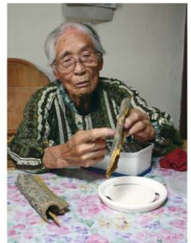
おばあちゃんの家裏山でとれたというキハダを見せて頂いた。

キハダは黄蘗(おうば く)とも呼ばれ、健胃薬 として有名な高野山の陀羅尼助 (だらにすけ)もキハダが主成分。現代 は、胃腸の薬として用いられることが