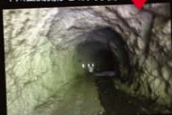
▲トンネルに入ると、しばらくは素掘りの壁面が続く。