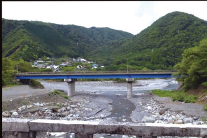
▲春木川橋の上から下流を見る。歴史を感じさせる石造の欄干(手前)は、竣工当時のものか。下流には、現在の県道を通る新春木川橋が。その向こうには、薬袋集落が見える。