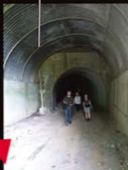
▲トンネルは、途中から広くなる。境目には、注意を促す標識が。