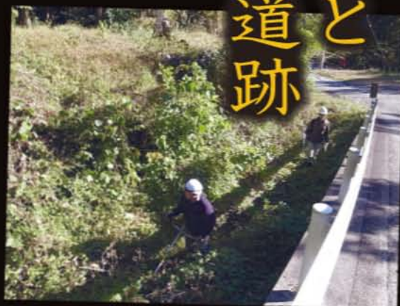
▲第一白石トンネルの内部を調査すべく、入り口付近に生い茂る草木を切り倒しながら進む取材班。

さらに西側に、昭和初期に採掘された初代のトンネルがある。北側の入口は付近の土砂崩れでその場所を確認することができず、南側からは入ることができた。しかし、内部は暗く一部崩落しており、しみ出した水で水浸しであった。奥の様子は肉眼では確認できなかったが、撮影には成功し、トンネルの壁などは意外なほどきれいに残されていることが分かった。初代のトンネルが掘られる前は、このトンネルの上に「つむじの尾根」といわれる峠道があり、白石から西之宮へはこの峠道が