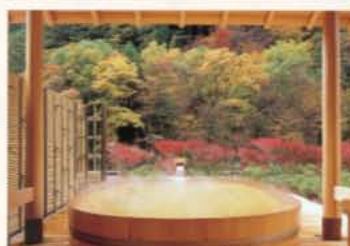
▲西山温泉慶雲館自慢の野天風呂