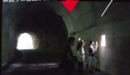
▲さらに進むと、壁面から光が差し込み、トンネル内の様子もうっすらと見えてくる。