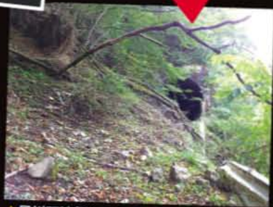
▲早川下流側からも道が残っているが、途中が崩れており、入り口には近づけない。

現在の県道は、これより高い位置にあり、トンネルも大きく長く直線で、安全で走りやすいが、それと引き替えに、美しい自然を感じにくくなってしまったことは残念でもある。