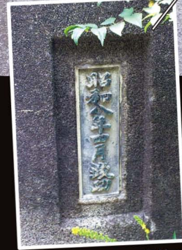
▲春木川右岸側の親柱のうち下流側には、「昭和八年四月竣工」と鑄られた銅板が付けられている。