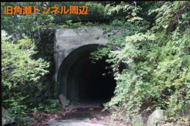
旧角瀬トンネル、早川上流側からの入り口