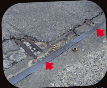
▲軌道跡。舗装された路面の割れ目から、2本のレールが確かに見える。レールが現存するのは、町内でもここだけではないだろうか。